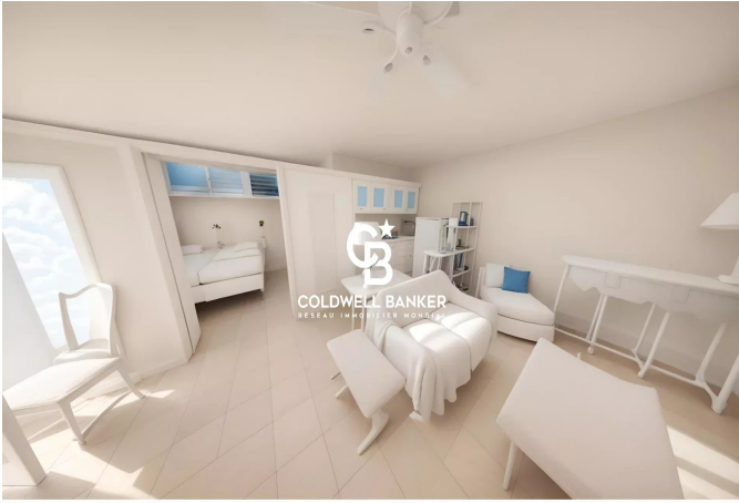
Laissez-vous inspirer par cette suggestion de rénovation imaginée grâce à l'intelligence artificielle.