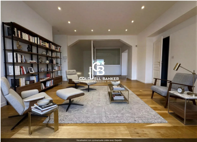
Visualisation non contractuelle créée avec Gepetto