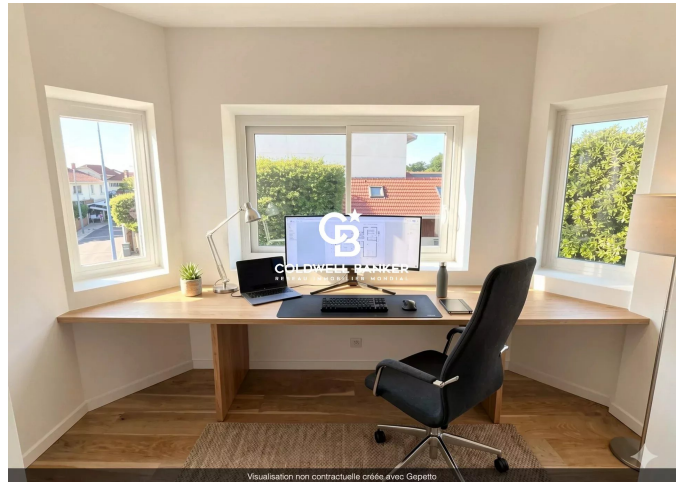
Visualisation non contractuelle créée avec Gepetto

182 boulevard de la République France, 33510, Andernos-les-Bains