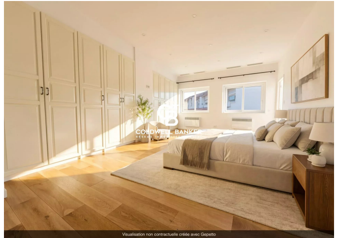
Visualisation non contractuelle créée avec Gepetto