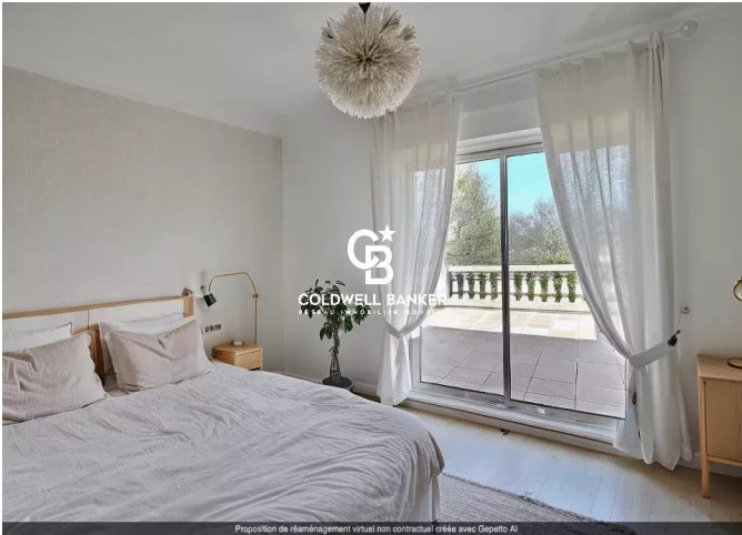
Proposition de réaménagement virtuel non contractuel créée avec Geppetto AI