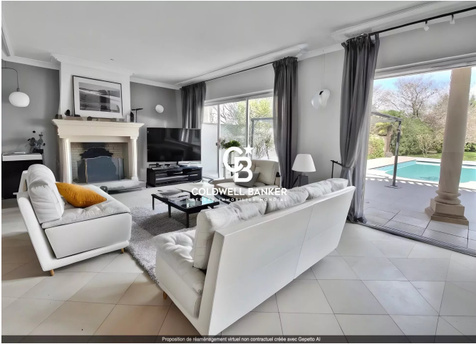
Proposition de réaménagement virtuel non contractuel créée avec Geppetto AI