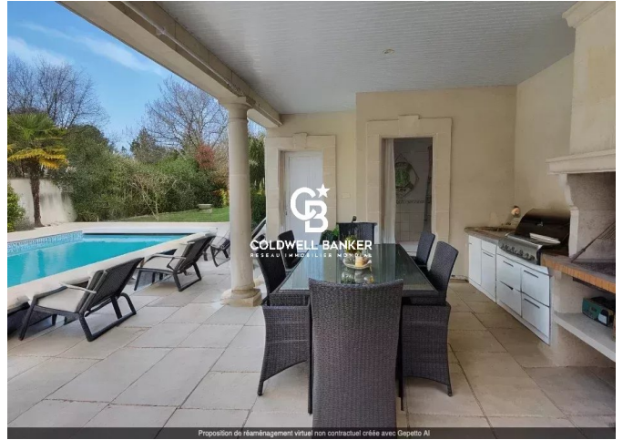
Proposition de réaménagement virtuel non contractuel créée avec Geppetto AI