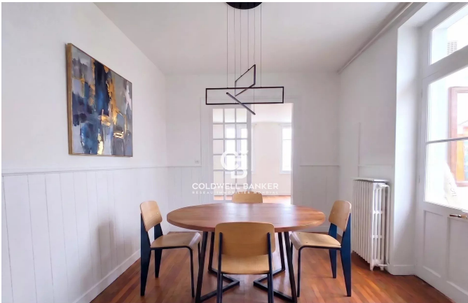
PROPOSITION D'AMÉNAGEMENT ✦